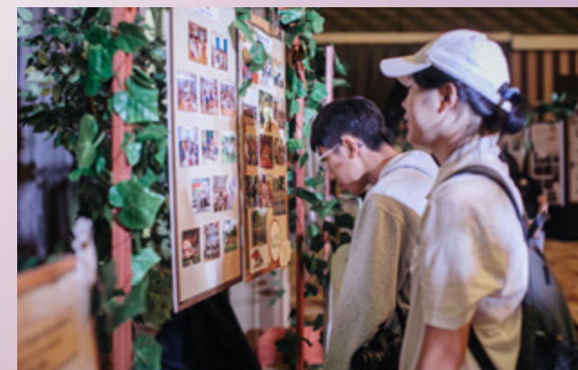
细品历史走廊中的恩典。